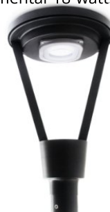
Luminária Pública Ornamental 18 watts (https://www.lasled.com.br/luminaria-publica-ornamental-18-watts)

(https://www.lasled.com.br/luminaria-publica-ornamental-18-watts)