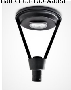
Luminária Pública Ornamental 100 watts (https://www.lasled.com.br/luminaria-publica-ornamental-100-watts)

(https://www.lasled.com.br/luminaria-publica-ornamental-100-watts)