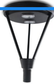
Luminária Pública Ornamental 120 watts (https://www.lasled.com.br/luminaria-publica-ornamental-120-wattts)

ORÇAR Q (https://www.lasled.com.br/luminaria-publica-ornamental-120-wattts)